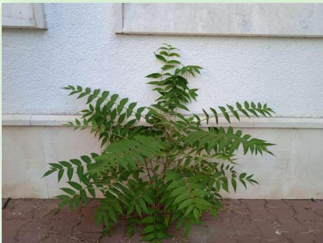
Fotografisano u blizini škole "Dr Dragiša Ivanović", 16.septembra 2021.