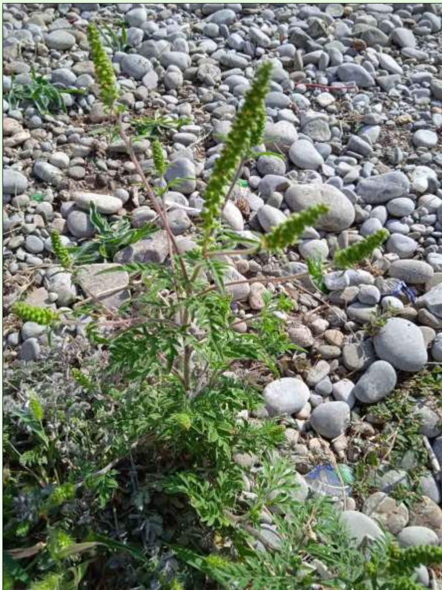
Fotografisano u blizini škole "Dr Dragiša Ivanović", 16.septembra 2021.