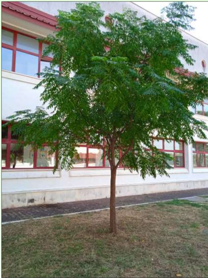
Fotografisano u dvorištu škole "Dr Dragiša Ivanović", 16.septembra 2021.