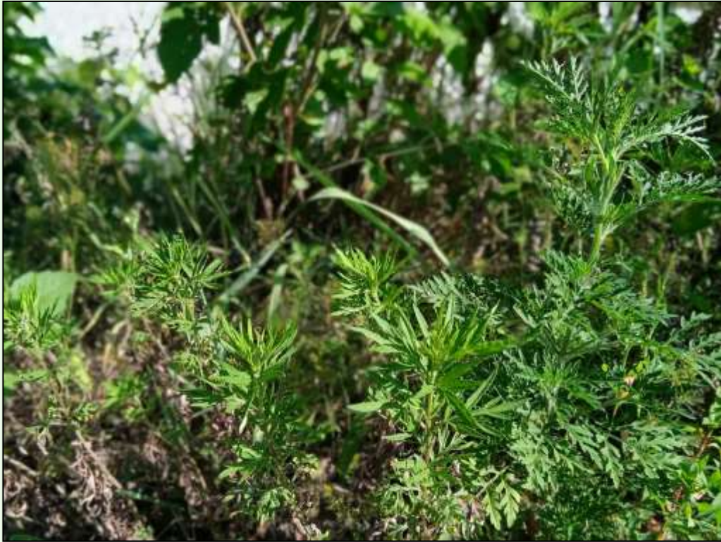
Fotografisano na obali Ribnice, 25.juna 2021.