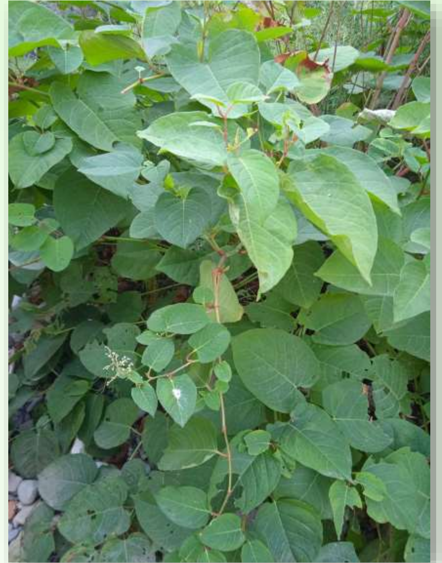
Fotografisano na obali Ribnice, 25.juna 2021

Japanski troskot (u narodu poznatiji kao japanski dvornik) je biljka iz porodice trava i vrste troskota. Najčešće raste u gradovima i pored puteva a pravi veliku štetu drugim biljnim vrstama. Suzbijanje je teško jer je ova biljka veoma otporna.