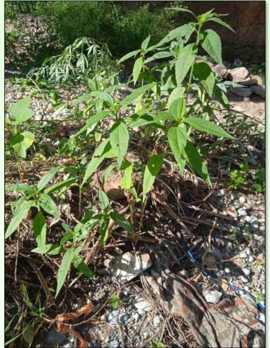
Fotografisano na obali Ribnice, 25.juna 2021

Suncokret je jednogodišnja biljka iz porodice glavočika. Kada se javi u usjevima naziva se samonikli suncokret jer može napraviti veliku štetu gajenim biljkama i usjevima. Ima dubok korijen i teško ga je iskorijeniti jer čak i mala količina može proizvesti veliku rezervu sjemena u zemljištu.